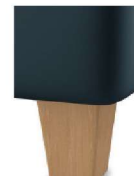
H17-10 H17-15 Holzfuß Buche natur lackiert gegen Aufpreis