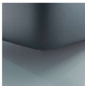
K08-10 K08-15 Schwebeoptik Standard