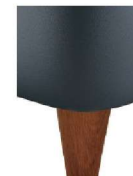
H25-10 H25-15 Holzfuß Eiche natur geölt gegen Aufpreis