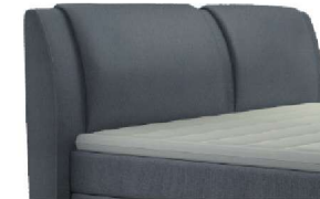
0327 Höhe 108 cm gegen Aufpreis