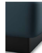
S08-10 S08-15 Bettsockel schwarz gegen Aufpreis