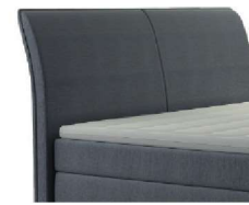
0022 Höhe 106 cm gegen Aufpreis