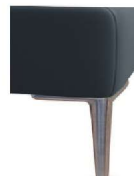
A11-10/M12 A11-15/M12 Alufuß gebürstet gegen Aufpreis