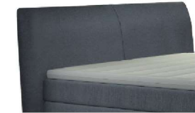
0689 Höhe 119 cm gegen Aufpreis