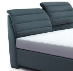
0850KV Höhe 112-123 cm nur lieferbar bei Bettgrößen 160-200cm Breite gegen Aufpreis