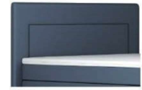
0025 Höhe 122 cm gegen Aufpreis