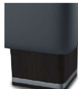
H05-10 H05-15 Holzfuß wengefarbig gegen Aufpreis