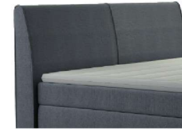
0023 Höhe 106 cm gegen Aufpreis