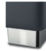
M09-10 M09-15 Metallfuß verchromt gegen Aufpreis