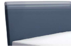
0300 Multimaß Höhe 55 - 125 cm in 5cm-Schritten kürzbar gegen Aufpreis