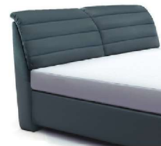
0850 Höhe 112 cm nur lieferbar bei Bettgrößen 160-200cm Breite gegen Aufpreis