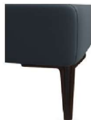
A11-10/M01 A11-15/M01 Alufuß schwarz matt gegen Aufpreis