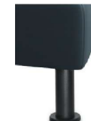
M24-10 M24-15 Metallfuß schwarz gegen Aufpreis