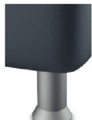
K01-10 K01-15 Kunststofffuß alufarbig preisgleich