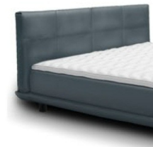
0856 Höhe 75 cm preisgleich