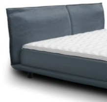
0855 Höhe 75 cm Standard