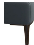
A11/M01-15 Alufuß schwarz matt preisgleich