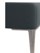
A11/M12-15 Alufuß gebürstet preisgleich